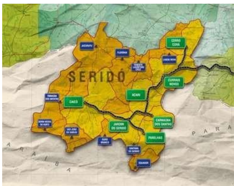
Figura 1- Mapa da Região Seridó

A FCST está inserida na Região do Seridó como um importante veículo de formação profissional para diversos municípios, visto que no entorno do município de Caicó, dentro de um raio de 100 km, aproximadamente, estão situados os municípios Jardim do Seridó, Carnaúba dos Dantas, Parelhas, Acari, Serra Negra do Norte, Cruzeta, São José do Seridó, São João do Sabugi, Ouro Branco, Santana do Seridó, Ipueira, Equador, São Fernando, Timbaúba dos Batistas, Jardim de Piranhas e Jucurutu.