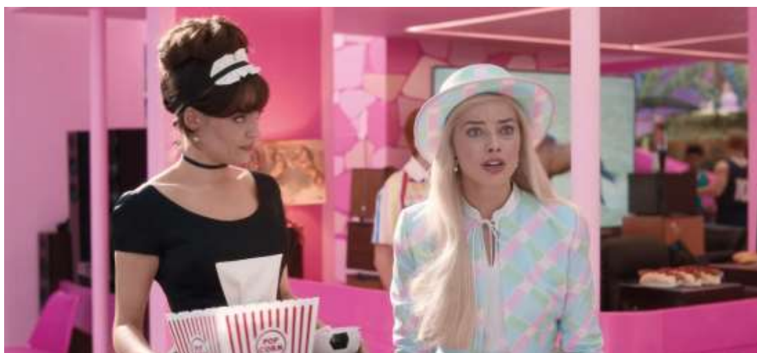
Figura 4 – Barbie conhecendo a Kendom.

A tomada de controle pelos Kens evidencia como homens, ao se inserirem em sistemas de poder, são estimulados a reproduzir comportamentos hierárquicos, muitas vezes sem perceber que estão apropriando-se de espaços antes construídos coletivamente. A cena funciona como uma metáfora do patriarcado: não é necessário destruir mulheres diretamente; basta reorganizar o ambiente de modo que elas se tornem coadjuvantes, mantendo a autoestima masculina e servindo como plano de fundo para sua ascensão.