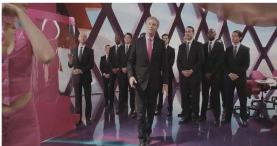
Figura 3 – Barbie fugindo dos executivos da Mattel.

A cena do filme que envolve a reunião de Barbie com a Mattel destaca precisamente esses dados, com uma crítica direta às dinâmicas de poder presentes na realidade social. Ao buscar conforto em um ambiente no qual foi criada, imaginando encontrar uma perspectiva diferente da que enfrentou ao longo do dia, em que os homens dominam os ambientes de trabalho e as mulheres não são vistas em nenhum em cargo de liderança, Barbie pergunta: “Já que estou aqui, posso conhecer a mulher que está no comando?”. Ao questionar sobre os cargos de liderança, ela recebe, um a um, a resposta de que cada direção está sob comando de um homem. O jovem Aaron, com humor depreciativo, completa: “Eu sou um homem sem poder, então eu sou uma mulher?”.