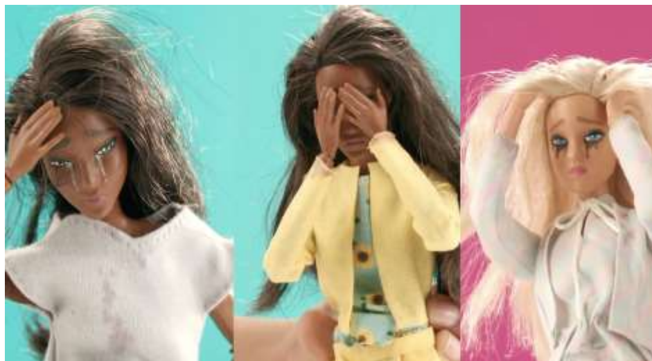
Figura 9 – Propaganda retratada do filme vendendo a Barbie Depressão