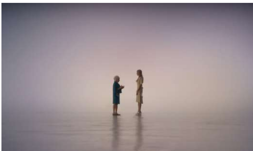
Figura 12 – Barbie escolhe ser humana

Nesse contexto de pressões estéticas, emocionais e produtivas que moldam a experiência feminina, o desfecho do filme Barbie surge como um contraponto simbólico poderoso. Ele representa a ruptura definitiva com o ciclo de perfeição idealizada que sustentou a boneca por décadas. Após sua conversa com Ruth Handler, criadora que a confronta com a ideia de que ser humana significa criar, errar, sentir e transformar, Barbie escolhe abandonar a condição de ideal para assumir a realidade concreta da existência.