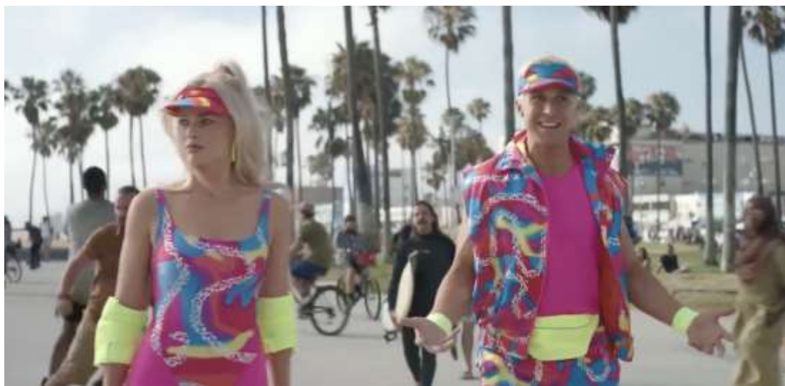
Figura 2 – Barbie e Ken chegam ao mundo real.

assédio e desrespeito. Estes elementos simbolizam a violência cotidiana enfrentada por mulheres em ambientes públicos e nos contextos laborais.