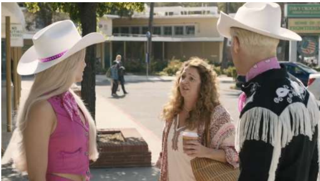
Figura 6– Barbie e Ken conversam com uma mãe na escola