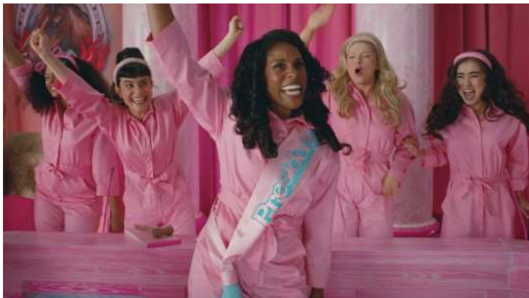
Figura 10 – Barbies comemorando após retomar a Barbielândia