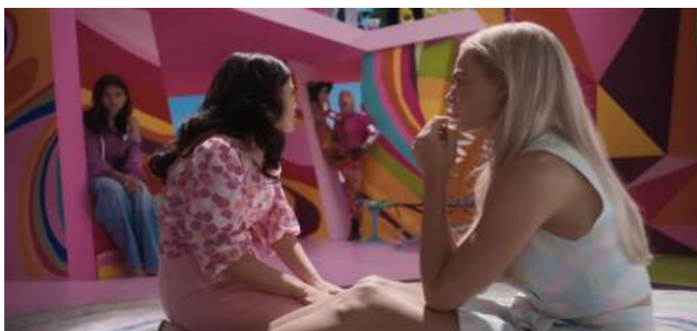
Figura 10 – Monólogo da Gloria sobre Mulheres

No filme, o processo de construção da autonomia feminina começa a ganhar força a partir do momento em que Barbie, pela primeira vez, confronta a sensação de insuficiência, a percepção dolorosa de “não ser bonita o suficiente, inteligente o suficiente ou boa o suficiente”. Esse deslocamento interno marca uma ruptura importante: a personagem que sempre representou a perfeição passa a experimentar o que significa falhar diante de expectativas inalcançáveis. A partir dessa fissura, o longa prepara o terreno para uma reflexão mais profunda sobre as pressões que moldam a vida das mulheres.