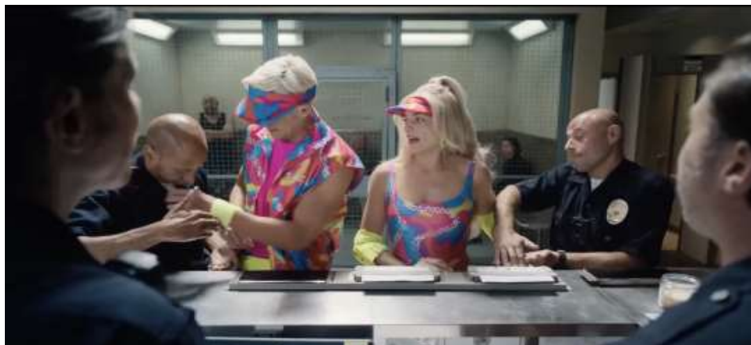
Figura 5 – Barbie e Ken são presos